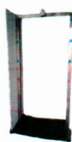
Arco de Descontaminação

Neste periodo coberto por este Relatório de Comunicação de Progresso, não foi registado nenhum caso de acidente de trabalho, nem de violação de direitos humanos na empresa.